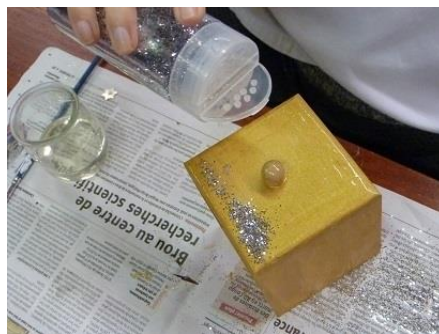
Nathalie à l'œuvre !