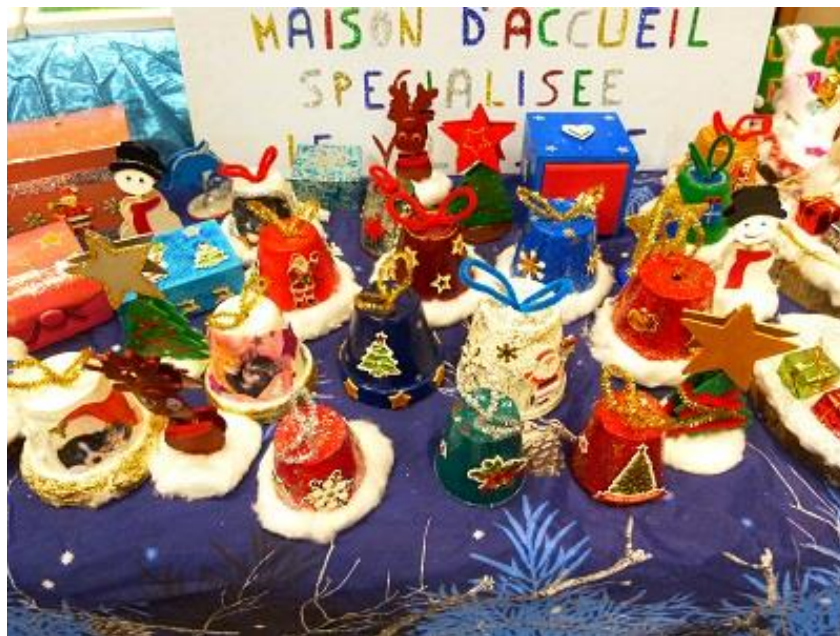
STAND DU MARCHE DE NOEL 2014