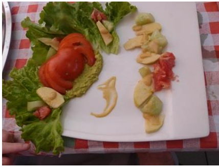
« MA MODESTE CREATION ! »