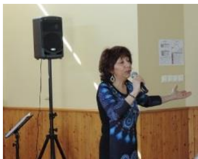
« Voici la chanteuse... »