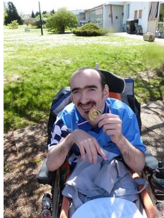
« ...une expérience à tenter que je referais volontiers »