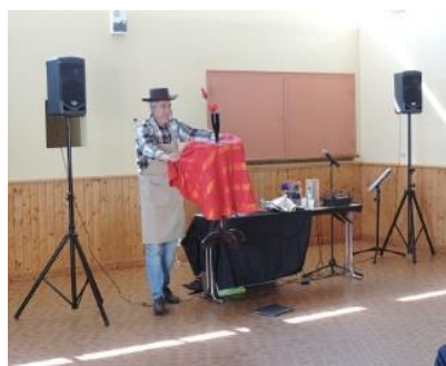
« Et le magicien... »