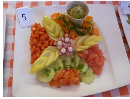
« Celle d'un autre... »