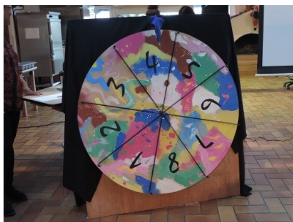
Le jeu de la roue du 22 décembre