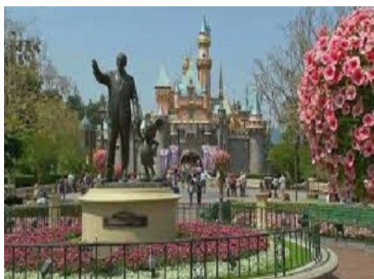
Disneyland en floride