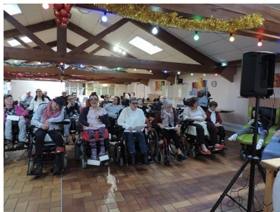
Le karaoké du 29 décembre